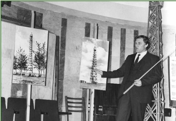
Выступление в Политехническом музее (1988 г.)

Действительно, за 44 года работы в качестве руководителя я никого не уволил по этому пункту трудового кодекса, хотя такие предложения поступали неоднократно от моих заместителей и помощников. В геодезию, картографию и топографию приходят молодые специалисты со среднетехническим и высшим образованием. Значительная часть увольняется в первые годы работы. Если не уволился сам в начале профессионального пути, значит остался работать, как правило, на всю оставшуюся жизнь. В нашей отрасли, в основном, работают скромные, порядочные и, главное, трудолюбивые люди.