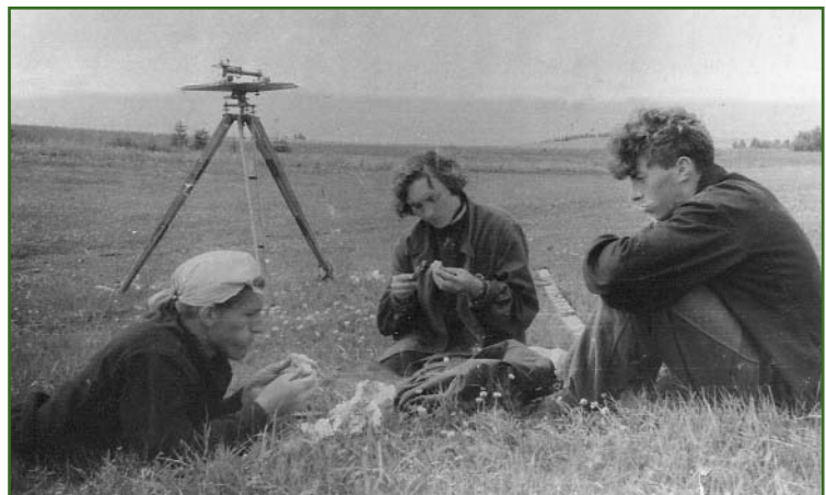
На производственной практике в Ленинградском аэрогеодезическом предприятии (1957 г.)

Так, в 1955 г. я стал студентом Ленинградского топографического техникума, который окон-