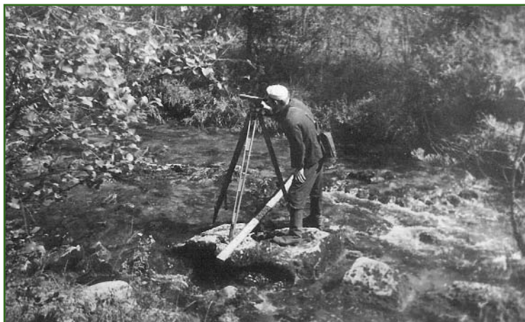
Работа топографом геологической партии в Якутии. Геометрическое нивелирование (1959 г.)