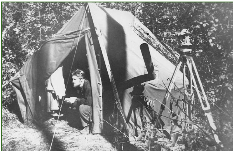
Работа топографом геологической партии в Якутии (1959 г.)

чил с отличием в 1958 г. по специальности «топография». В том же году продолжил учебу в Московском институте инженеров геодезии, аэрофотосъемки и картографии (МИИГАиК) и в 1964 г. получил диплом по специальности «инженер астрономо-геодезист».