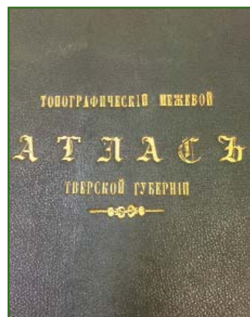
Рис. 5 Обложка «Топографического межевого атласа Тверской губернии ...», 1853 г.

научном отношении Императорским русским географическим обществом, изданного по Высочайшему повелению в 1853 г.» [12] приведена на рис. 5. Листы атласа отпечатаны литографским способом в типографии Межевого корпуса. Атлас отличается высоким качеством цветной печати. На карты точно нанесены землевладения; малые участки, подобно «Атласу Калужского наместничества», показаны на врезках. Атлас дополнен планами уездных городов, снабженных легендами и справочными данными.