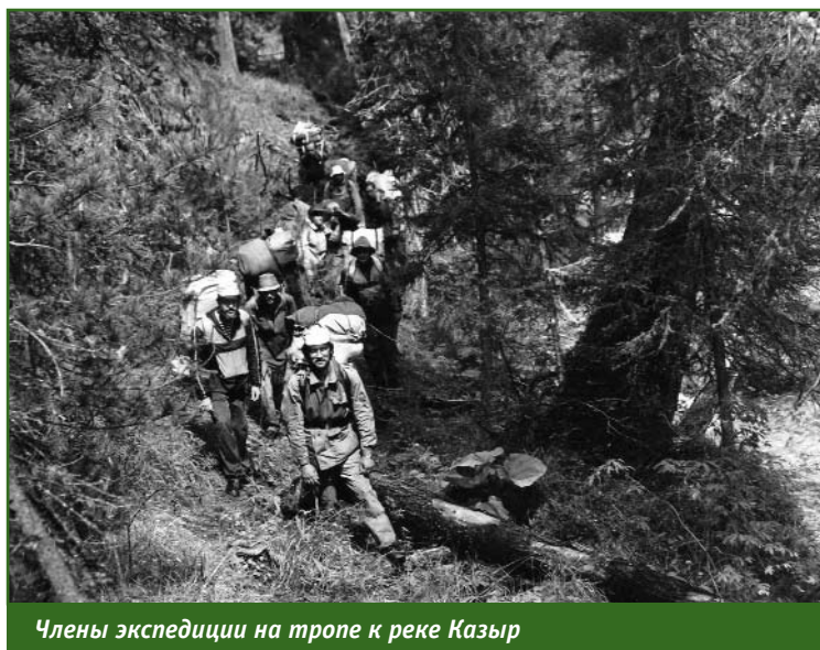
Члены экспедиции на тропе к реке Казыр