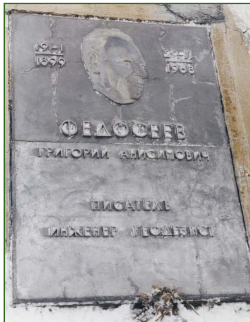
Памятная доска на одной из восьми граней в основании мемориала Г.А. Федосееву