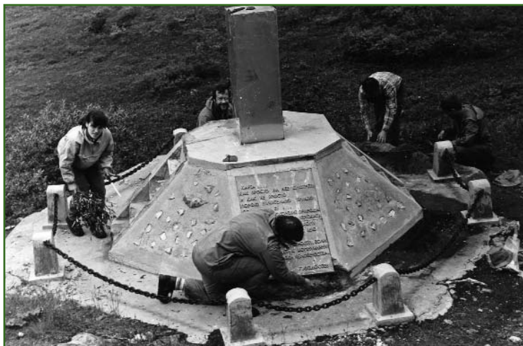
Восстановительные работы на мемориале Г.А. Федосееву