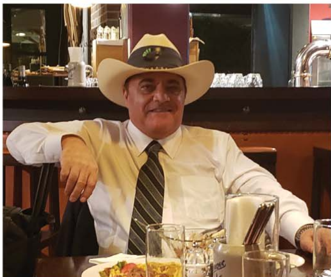
На выставке INTERGEO 2019, Штуттгарт

финансового кризиса в России), организацию самых передовых современных производственных мощностей в Калифорнии (во время финансового кризиса в США), а также техническими и операционными возможностями, которыми обладают эти предприятия. Нет ни одной компании в нашей отрасли, которая была бы на переднем плане инноваций и технологий, подобно компании JAVAD. Самые современные продукты мы создавали с вашим участием и помощью. Мой отец всегда гордился своей большой