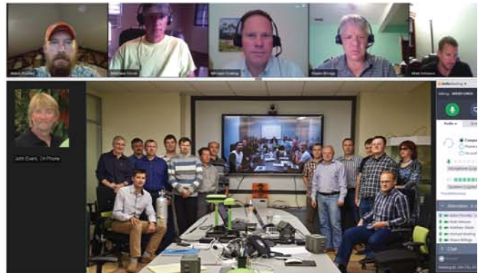
Коллектив JAVAD PLS-US, США