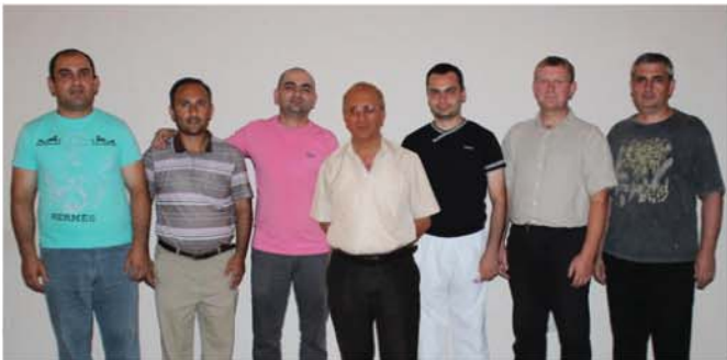
Коллектив JAVAD Armenia, г. Ереван