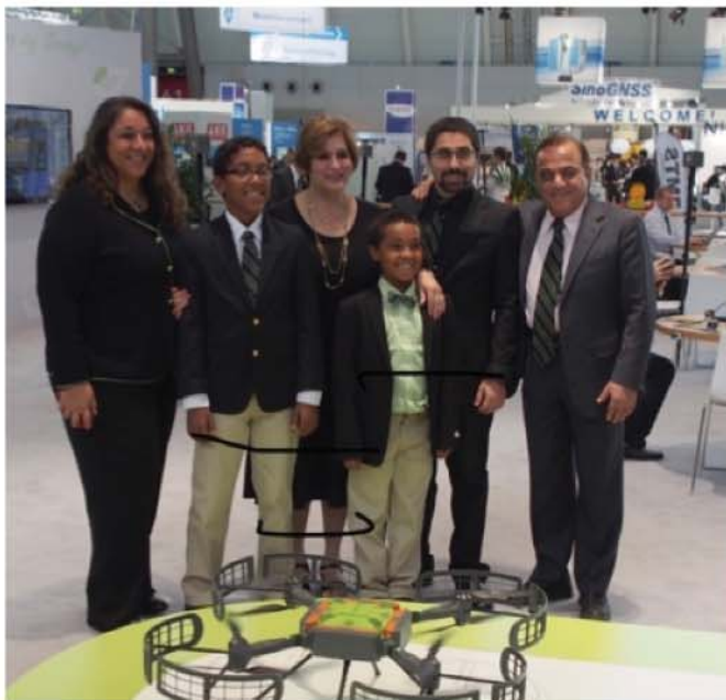
С детьми и внуками