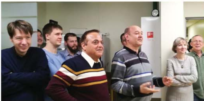
Коллектив JAVAD GNSS, г. Москва

слова звучат в наших сердцах, и мы не разочаруем отца, станем первыми в мире. Наши сердца разбиты утратой, но решимость двигаться вперед сильнее, чем прежде. Весь мир знает, что компания JAVAD — особенная. С удвоенной энергией мы продолжим дело, начатое отцом, и останемся абсолютными лидерами. Мы будем жить и работать каждый день, будем становиться лучше и продолжать внедрять инновации, развивать компанию, которую отец основал много лет назад. Именно такой подход к делу заложил в нас он сам, и мы точно знаем, что именно этого он ожидает от всех нас, в условиях, когда нужно дви-