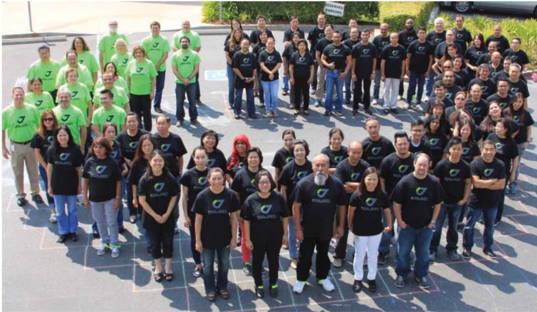
Коллектив JAVAD GNSS и JAVAD EMS, г. Сан-Хосе, Калифорния