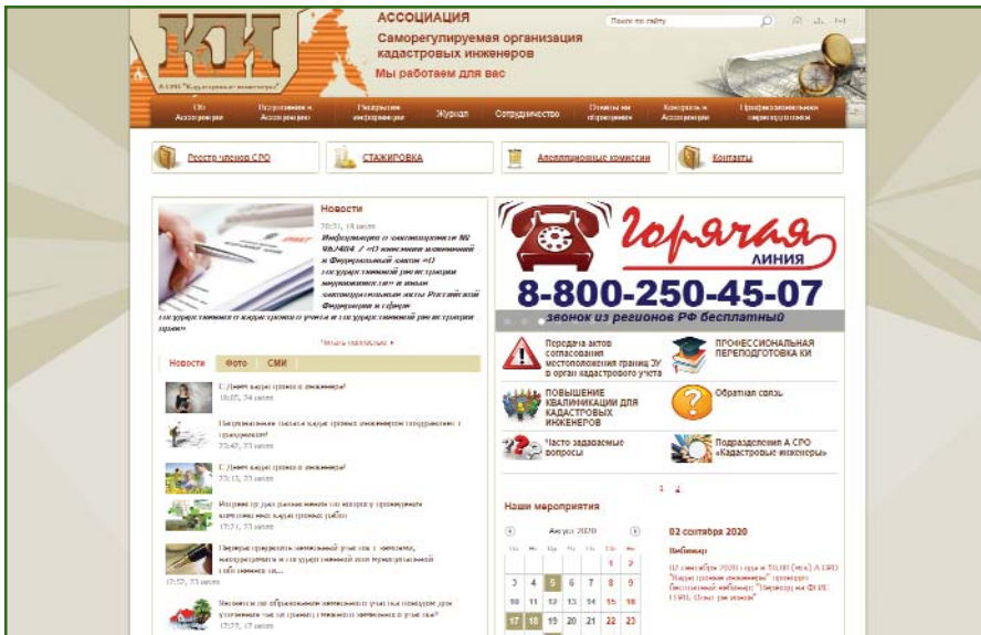
Рис. 4 Официальный Интернет-сайт А СРО «Кадастровые инженеры»