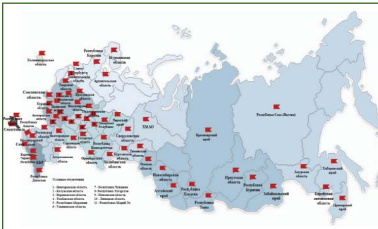
Рис. 2 Региональные подразделения А СРО «Кадастровые инженеры»

В связи с тем, что члены Ассоциации осуществляют кадастровую деятельность на территории всей страны, функционирование А СРО «Кадастровые инженеры» в полном объеме возможно только при наличии эффективно работающих региональных обособленных подразделений (рис. 2).