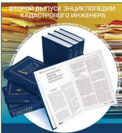
Рис. 5 Энциклопедия кадастрового инженера

В 2019 г. концепция проведения Всероссийского конкурса была пересмотрена.