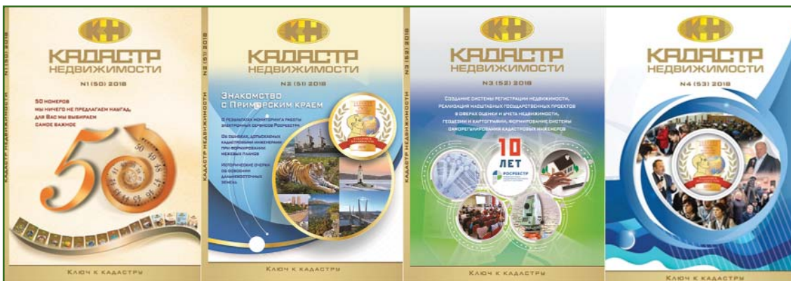
Рис. 3 Годовой комплект подписки журнала «Кадастр недвижимости» за 2018 г.