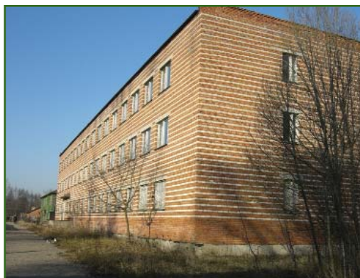
Учебно-лабораторный и жилой комплекс на полигоне Заокский

В 1991 г. был подписан договор о сотрудничестве с Московским государственным университетом геодезии и картографии (МИИГАиК) и коллед-