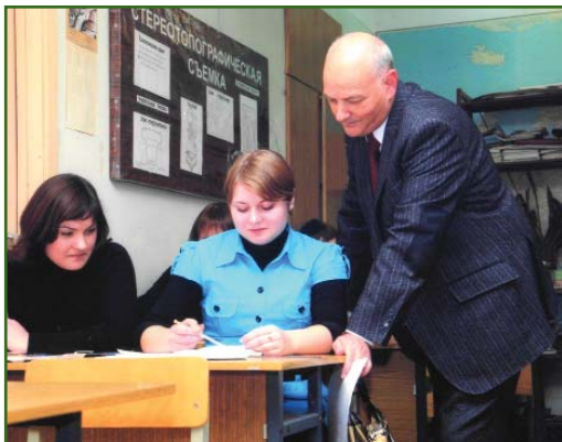
Учебные занятия в МКГиК

дарственного образовательного стандарта по этой специальности, которая внедрена в нескольких сотнях средних специальных учебных заведений России, а также принимал самое активное участие в разработке Федерального государственного образовательного стандарта третьего поколения по специальности «Прикладная геодезия».