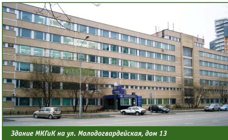
Здание МГУиК на ул. Молодогвардейская, дом 13